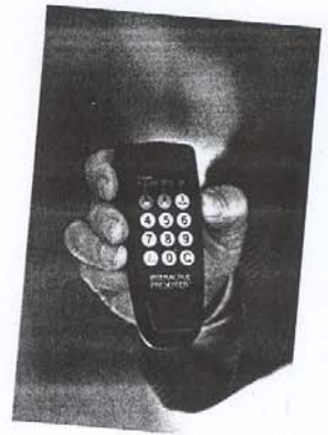
Dolphin Interactiven kehittämä äänestyskoje toimii radioaalloilla.

tiinit, laitteet ja ohjelmat varmistuvat, käytäntö siirretään jonain päivänä lautakuntien ja kaupunginhallituksen kokouksiin.